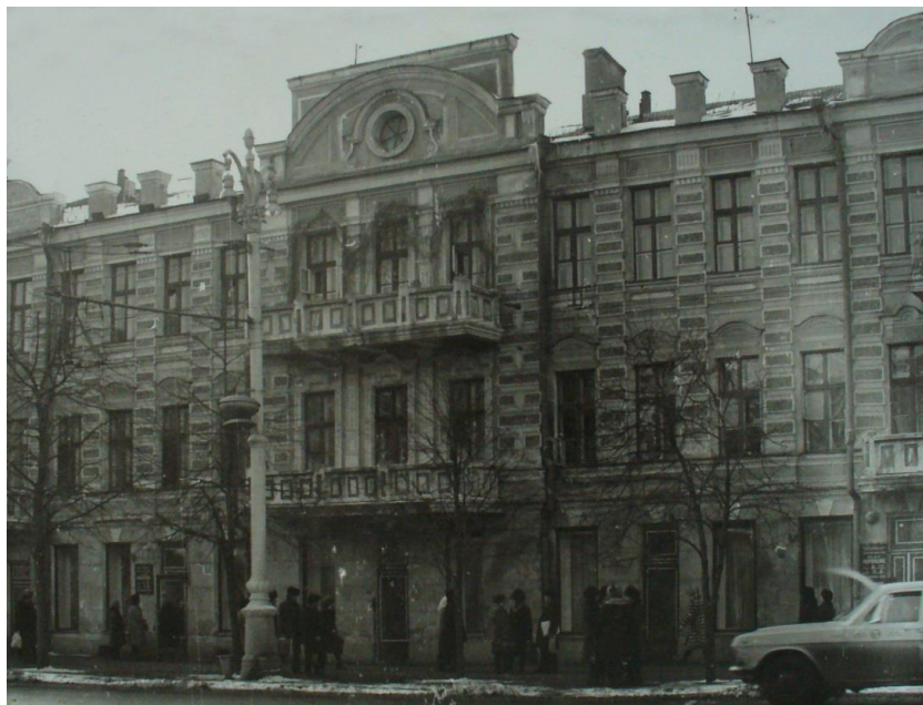
Дом Самофалова, 1880-е годы. Архивное фото 1970-х годов.

«Здесь стоял дом, в котором жил народный поэт Алексей Васильевич Кольцов»