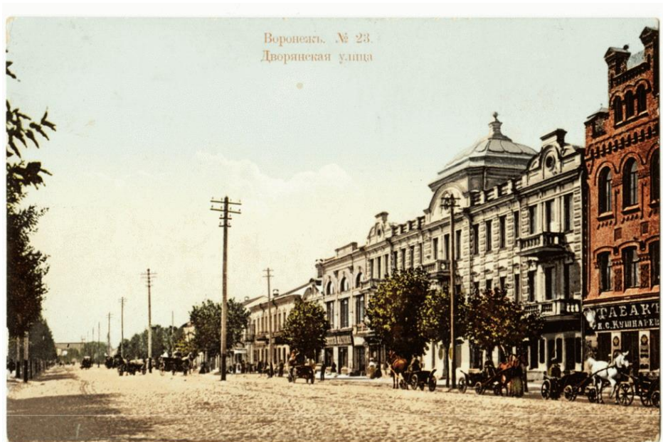
Дом Самофалова, 1880-е годы. Архивное фото начала XX века.

После 1917 г. здание называлось «Первым домом Советов», так как в нем размещались губернские административные учреждения. На первом этаже размещалось кафе-клуб «Железное перо», принадлежавшее Коммунистическому союзу журналистов (Комсожуру). Здесь собиралась творческая интеллигенция города: журналисты, актеры, писатели, художники; на этих заседаниях часто присутствовал писатель А.П. Платонов.